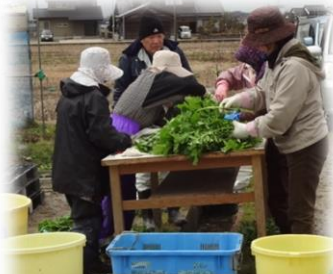
出荷準備の葉付き大根

eco 農園のハウスでは、大根と小松菜の収穫を終えました。大根は、市内の学校給食に採用され、「とても美味しい」と高評価をいただきました。今年も夏と秋にメロン、夏にとうもろこし、さらに自然栽培米作りに挑戦します。