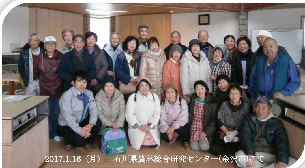
2017.1.16 (月) 石川県農林総合研究センター(金沢市)にて

私は神子原町出身で、神子原では、昔は各家庭で作っていたなと思い返していました。日本の伝統食である発酵食品を作る機会に参加できて楽しかったです。9 月の出来上がりが楽しみです。