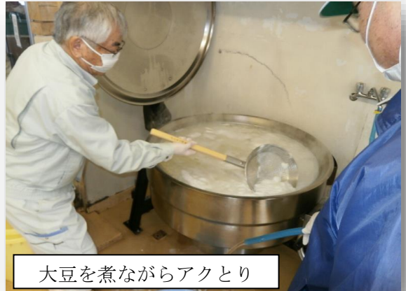
大豆を煮ながらアクとり