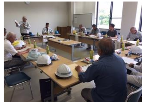
4センター合同意見交換会