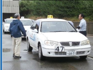
実際に教習コースを走行

毎年、この講習会には会員が積極的に参加しています。今年も9名が参加し、指導員と一緒にコースを走り、運転内容についてアドバイスを受けました。車は日々の生活に欠かせず参加した皆さんは安全運転への誓いを新たにしていました。