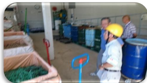
広い工場内から回収されたプラスチックごみや発泡スチロールなどを1カ所に集めて素材ごとに分別します。