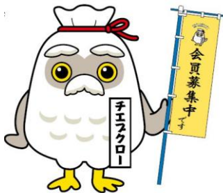
全シ協 キャラクター 「チエブクロー」