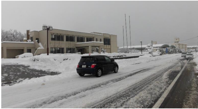
いつもは交通量の多いセンター前も、通る車はまばら。 撮影:1月12日正午頃