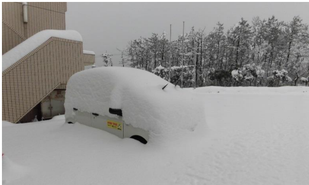
雪に埋もれた羽咋市シルバーの車。除雪する意欲も失せて・・・