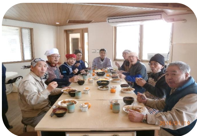
カレーとめった汁の昼食♪