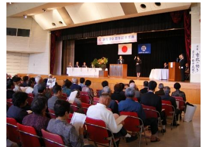
※設立20周年記念式典の様子