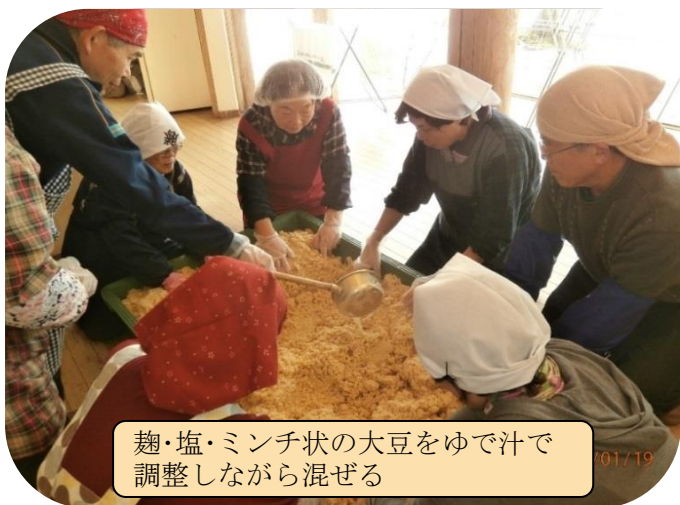
麴・塩・ミンチ状の大豆をゆで汁で調整しながら混ぜる